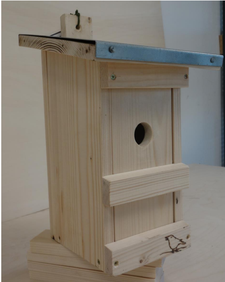
Foto vom Höhlenbrüterkasten

finde die fehlenden Angaben in der Materialliste